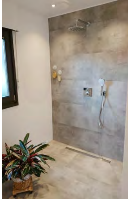
Ein weiterer Vorher-Nachher-Vergleich.

Ein Gegenbeispiel sei die jüngst abgeschlossene Sanierung einer Hofreite aus dem Jahr 1726 in Mainz-Bretzenheim: »Da war die Zusammenarbeit mit dem Denkmalamt absolut auf Augenhöhe. Viele Gespräche, viel Abstimmung – aber konstruktiv und zielführend.«