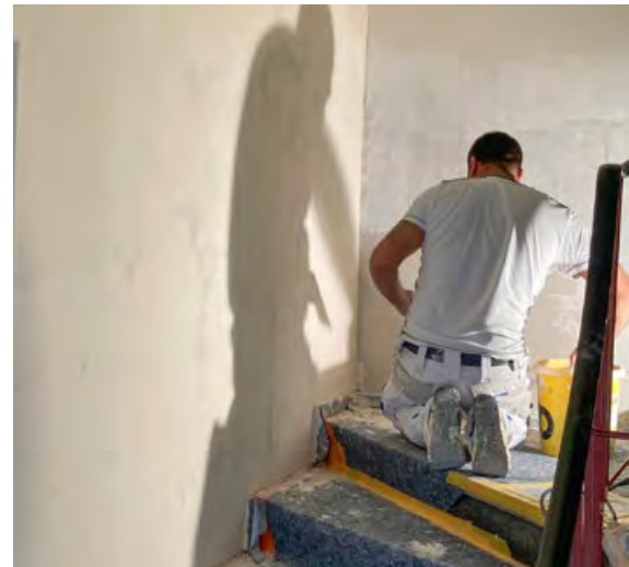
Links: Ein Vorher-Nachher-Vergleich.